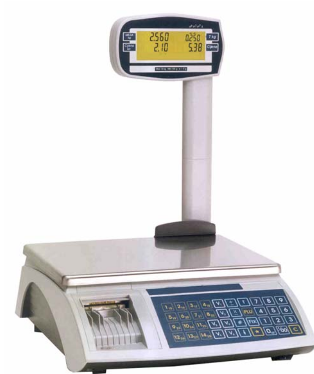
Slika 2 PRIMA-N/PTE