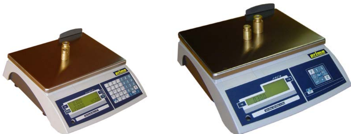
PRIMA-N/PT (pokazivači u kućištu)